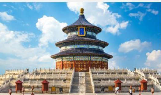
หอบูชาฟ้าเทียนถาน